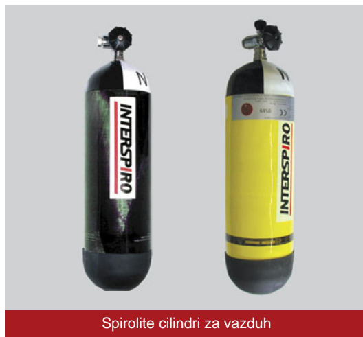
Spirolite cilindri za vazduh