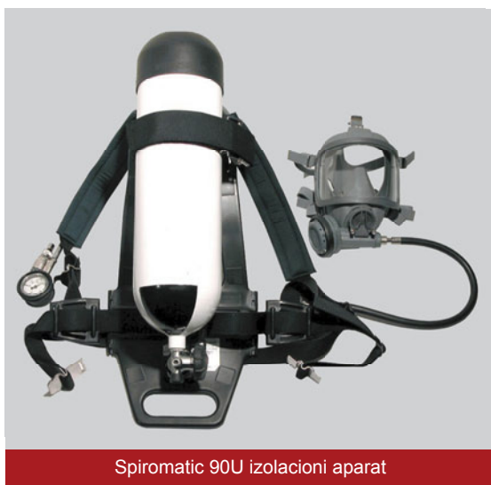
Spiromatic 90U izolacioni aparat

Pozitivni pritisak u maski za lice sprečava ulazak gasova, para i tečnosti iz okoline u masku. Automatski se aktivira prvim udisajem te je nemoguće zaboraviti aktivirati ga ili slučajno ugasiti.