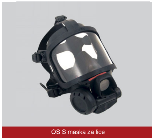
QS S maska za lice